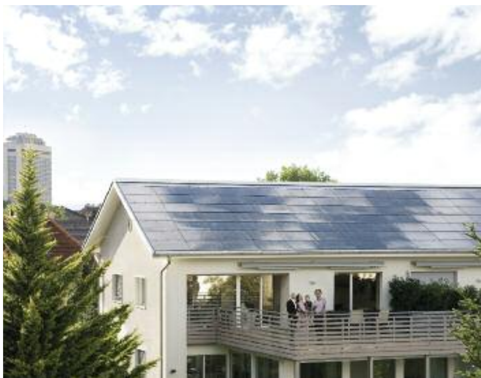
© 2011 Conférence des directeurs cantonaux de l'énergie