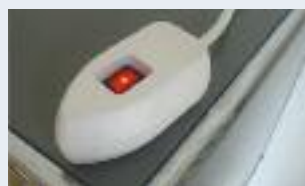
la souris peut être mise à portée de main

Il est maintenant de notoriété publique que les stand-by de nos multiples appareils constituent un énorme gaspillage d'énergie. Pour y remédier, les ordinateurs, imprimantes ou modems peuvent être branchés sur des multiprises, ce qui facilite le débranchement de plusieurs appareils à la fois. Mais devez-vous ramper sous le bureau à chaque fois que vous voulez les éteindre? Grâce à la souris qui facilite l'extinction des appareils et qui est branchée entre la prise et le bloc multiprise cela devient plus simple. En effet, la souris peut être installée à portée de main, soit sur le bureau soit sur un mur ou à un autre endroit facilement accessible.